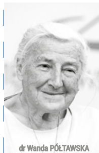
dr Wanda PÓLTAWSKA